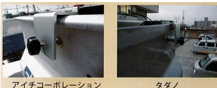
アイチコーポレーション

アイチコーポレーション、タダノ、主要2大バケットメーカー取付可能なケーブル縛り紐ボビンリールです。